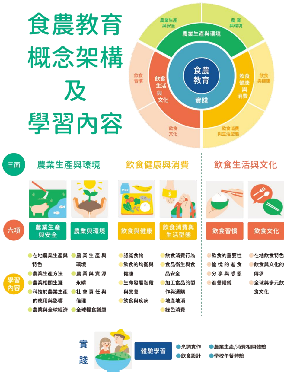
圖 1 食農教育概念架構及學習內容

資料來源：林如萍，食農教育之推展策略(一)：學校教育實施之概念架構分析，106年度國立臺灣師範大學產學合作計畫研究報告，頁 28。