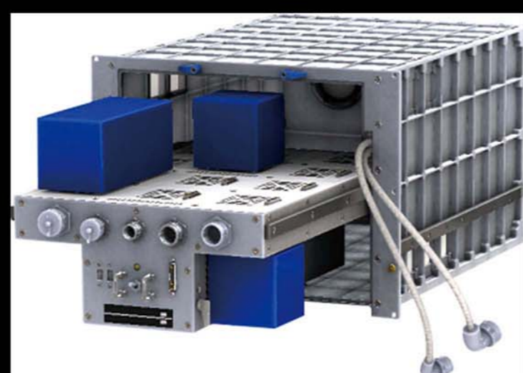
ESA ICE Cubes