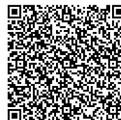
仿生設計思考介紹