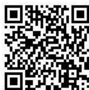
聯合國永續發展目標(SDGs)中譯版