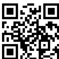
競賽報名網址 QR Code