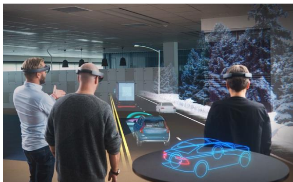
(示意圖由微軟提供)