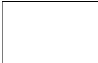
圖 1 XX