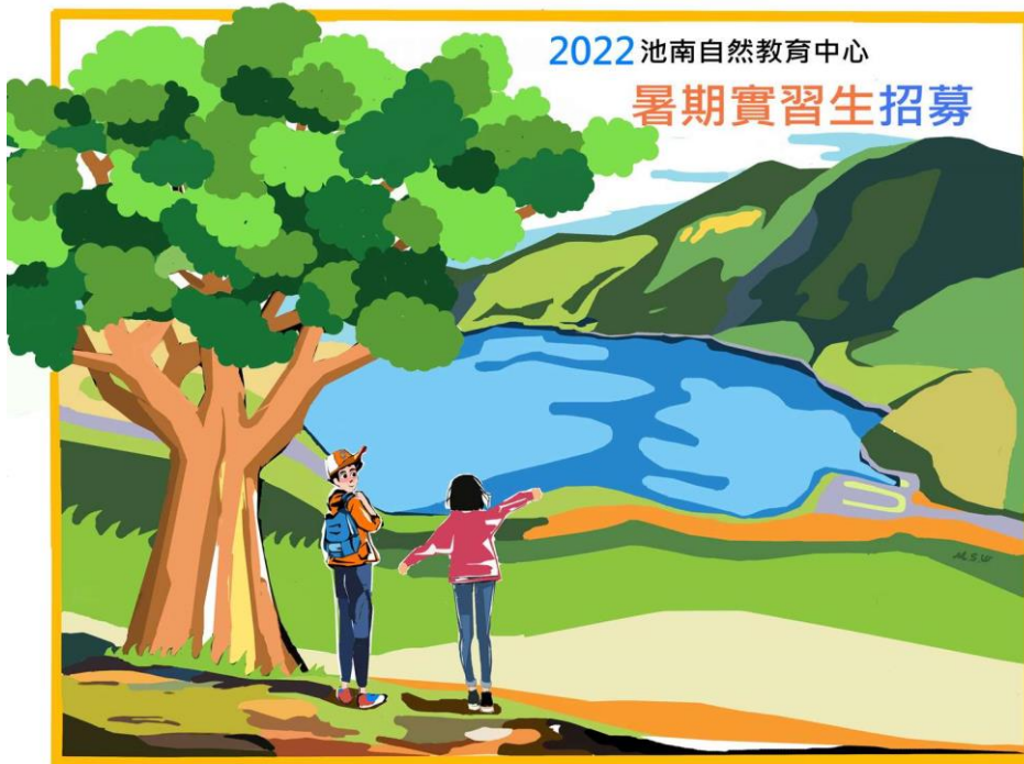
走入洄瀾時光森林，體驗低海拔山水之美，實踐友善環境生活

花蓮林區管理處為促進池南自然教育中心與大專院校學術機構合作，開創青年學子一個嶄新的學習環境，藉由理論與實務結合之培訓課程，提供學生參與環境教育及志願服務管道，以培育未來環境教育專業從業人員為目標，特訂定本計畫