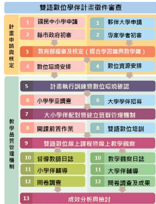
【圖2 雙語數位學伴計畫實施流程】