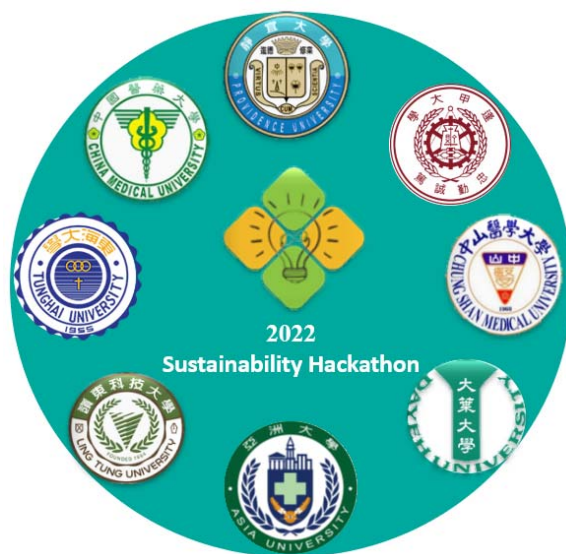
圖一：中部地區八校攜手合作

為培育當前青年學子銜接未來就業所需之能力，並集結跨領域之創新激盪，靜宜大學管理學院、資訊學院，偕同中國醫藥大學健康照護學院、公共衛生學院、人文與科技學院、醫學工程學院；亞洲大學產學營運處、資訊電機學院；逢甲大學商學院、全球村商管教育與產學推廣服務中心、智慧商業創新中心；大葉大學管理學院；東海大學管理學院；嶺東科技大學商管學院及中山醫學大學醫學院、口腔醫學院、醫學科技學院、健康管理學院；結合八校特色與優勢專業，建立「永續世代的韌性智慧創新協作平台」，鼓勵全國學生新創團隊前來挑戰企業命題需求。