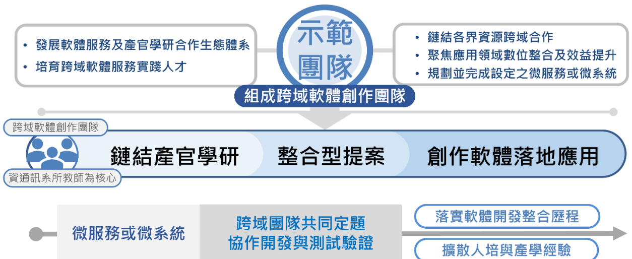
圖 4. 跨域軟體服務實踐人才培育示範團隊