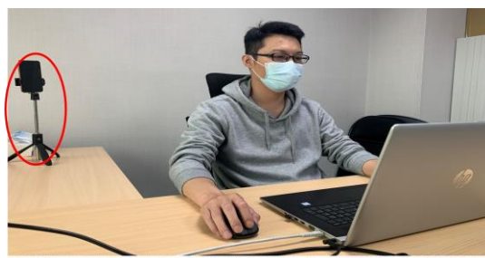
測驗期間需全程開啟視訊及麥克風，並將手機放置於您坐定的座位斜後方的平台四點鐘或八點鐘方向