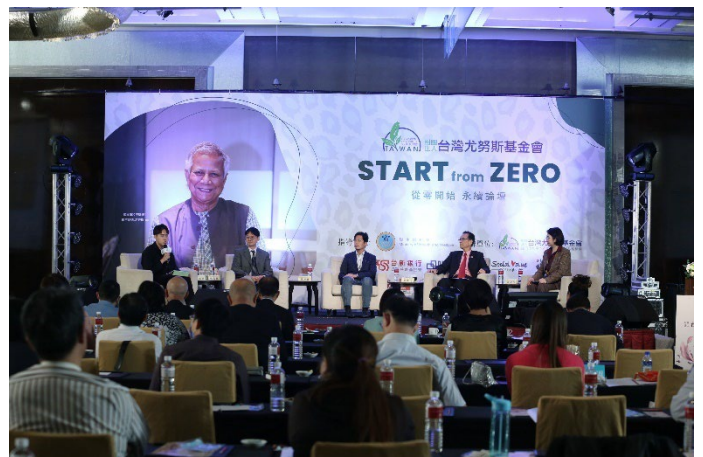
第二屆得獎者擔任本會 7 週年慶論壇分享者