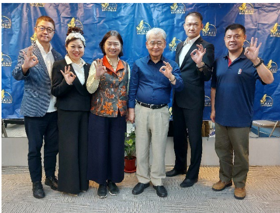
第一屆總決賽評審