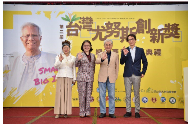
第二屆總決賽評審