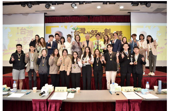
第二屆總決賽參賽團隊與評審合影