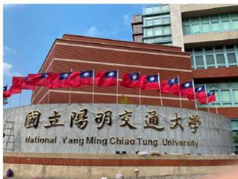
國立陽明交通大學醫學院醫學系 School of Medicine, National Yang Ming Chiao Tung University